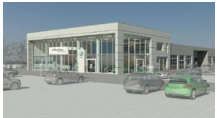
Mitte nächsten Jahres wird der neue Lindner-Standort beim Lagerhaus in Hof eröffnet.

Hyundai ergänzt das Portfolio Am bestehenden Standort wird sich alles um Hyundai, den Neu-