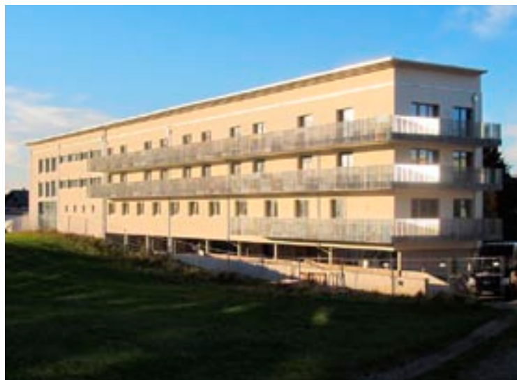
Das Musikum in Hof ist eines von vielen großen Bauvorhaben, die von Strabag in der Fuschlseeregion umgesetzt werden.

Fünf Millionen Euro wurden in den letzten fünf Jahren in den Standort Thalgau investiert. Strabag hat eine Vielzahl großer Bauvorhaben in der Fuschlseeregion umgesetzt – darunter auch die Red Bull-Zentrale in Fuschl am See. Aktuelle Projekte sind der Neubau der Volksschule Thalgau und das Musikum in Hof. „Bei der Vernetzung mit Subunternehmern achten wir darauf, wenn möglich örtliche Unternehmen