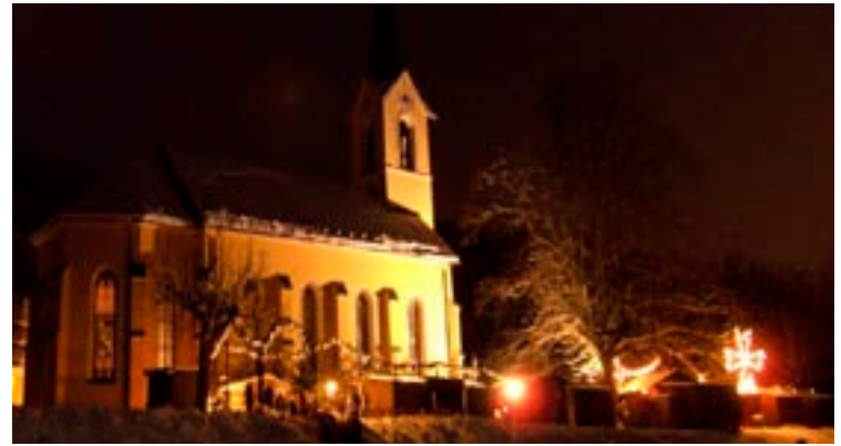
Der stimmungsvolle Markt ist an den Adventwochenenden jeweils am Samstag und Sonntag von 14.00 bis 19.00 Uhr geöffnet.

Anmeldung und weitere Informationen beim Tourismusverband Hof (Tel. 06229/2249).