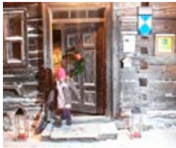
Kinder können beim Adventmarkt Kerzen ziehen oder einen Adventstern basteln.

■ HOF. Am 14. und 15. Dezember findet in der Tenne des Rauchhauses Mühlgrub in Hof wieder ein Adventmarkt statt. Er steht ganz im Zeichen der Handwerkskunst in der Fuschlseeregion. Von 14 bis 18 Uhr dreht sich alles um Klöppeln, Spinnen, Kreuzstich- und Klosterarbeiten, Holzkunst, Krippen sowie adventliche Bücher und Blumenarrangements. Wer noch ein schönes Weihnachtsgeschenk sucht, wird hier fündig.