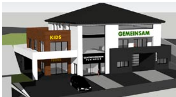
In unmittelbarer Nähe der Plainfelder Kirche wird ein zeitgemäßes und multifunktionales Gemeindezentrum errichtet.