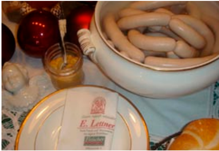
Die traditionelle Salzburger Würstelsuppe darf zu Weihnachten nicht auf dem Festtagstisch fehlen.

In den drei Lettner-Filialen in Guggenthal und in der Stadt Salzburg hat die Hausfrau die Qual der Wahl: Neben einer großen Auswahl an frischem Geflügel und heimischem Wild gibt es zartes Roastbeef mit Sauce Tartare, kleine Schinken vom Spanferkel, Leberpasteten, Wild-