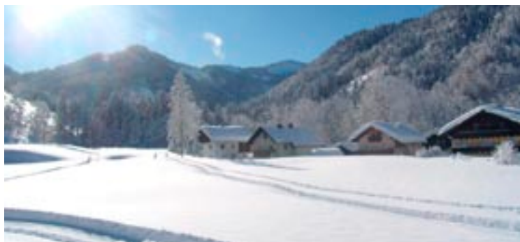
Ein Paradies im Schnee: Idyllische Winterlandschaften kann man in Hintersee so gut wie jedes Jahr genießen.

1. Dezember sowie die Ausstellung „Hinterseer Kunsthandwerk“ am 1. und 2. Dezember im Kunsthaus von Bernd Horak sowie im Pfarrhof Hintersee. Beginn ist jeweils um 14 Uhr. Ab Mitte Dezember kann bei entsprechender Schneelage die Hirschfütterung besucht werden. Der Eintritt ist nur gegen telefonische Anmeldung unter 0664/9589253 (Otto Oberascher) möglich.