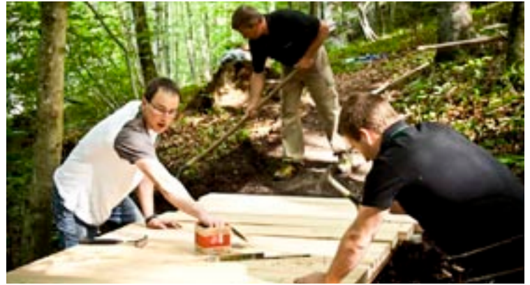
Die ehrenamtlichen Helfer setzen Wege instand und reparieren Sitzbänke.