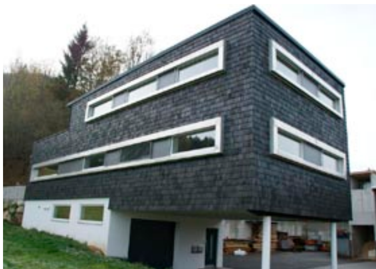
Zeigt die Vorzüge der Holzbauweise: das moderne Niedrigenergiehaus der Zimmerei Schlager.

Das Musterhaus der Firma Schlager in Hof kann auch besichtigt werden. Anmeldungen sind unter Tel. 06229/2414 möglich.