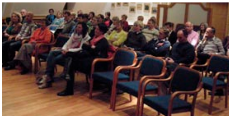
Die Vorträge der Ärzte und Gesundheitsexperten stießen auf großes Interesse.

Das genaue Programm finden Sie auf der Webseite des Veranstalters www.schuetzenkorps-ebenau.at .