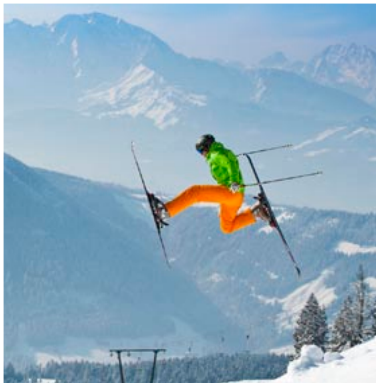
Pistenspaß und günstige Preise: Mitte Dezember soll der durchgehende Liftbetrieb in der Skischaukel Gaissau-Hintersee starten.